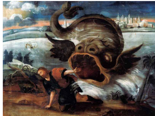
Die Initiation im Zeichen des Jona wird in dieser russischen Ikone dargestellt. Jona wurde ins Meer geworfen und von einem Wal verschluckt, in dessen Bauch er drei Tage und Nächte verbringt, bis er wieder ausgespuckt wird. Das geistige Geschehen kommt hier nicht zur Darstellung.