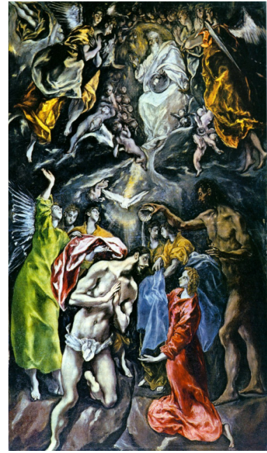
Auf dem Bild von El Greco wird der Täufling schon nicht mehr untergetaucht dargestellt, dafür ist aber die mit der Taufe verbundene geistige Erfahrung sehr betont.